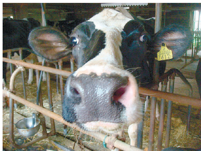
栄養価よりも量が必要なウシの口は幅広い=7月5日、八ヶ岳中央農業実践大学