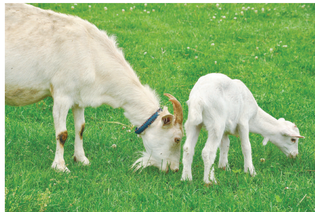
ヤギを見学できる「動物ふれあい広場」の草地で、仲良く草を食べるヤギの親子=7月10日、八ヶ岳中央農業実践大学