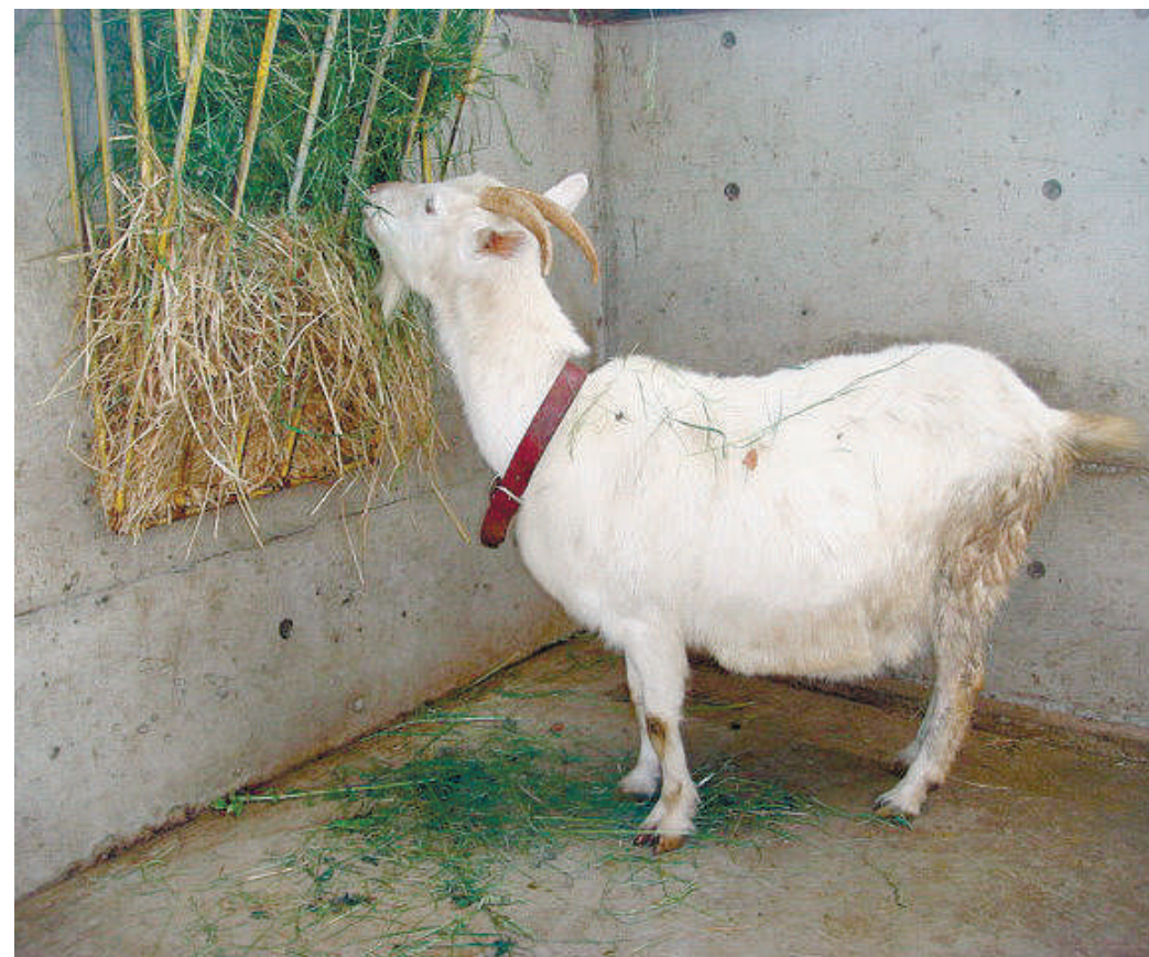
小さな動物ほど体重当たりの栄養要求量が多く、ヤギは草よりも芽吹きの中の葉やクローバーの方を好む。写真では、枯れ草よりも緑の新鮮な草を選んで食べている=6月17日、八ヶ岳中央農業実践大学