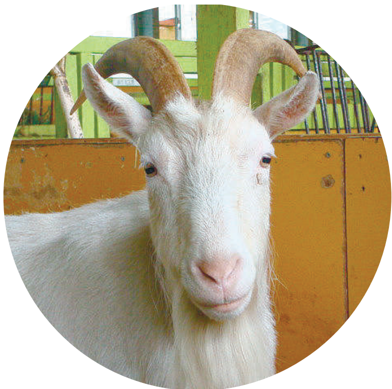
葉一枚一枚を選んで食べられるように、ヤギの上唇は裂け、良く動くようになってくる=7月5日、八ヶ岳中央農業実践大学