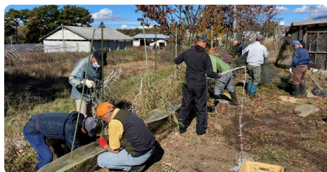
鶏の遊び場柵の解体