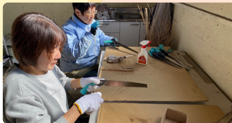
ノコギリの点検と手入れ