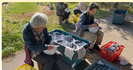
ヘルメットの点検と手入れ