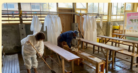
酪農スペースの清掃